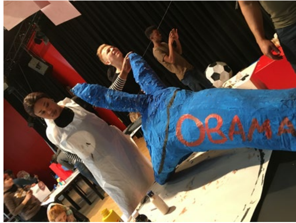
Abb.4: Objekt-Bemalung. KUNSTLABOR Graz, A. Fischer, 2018