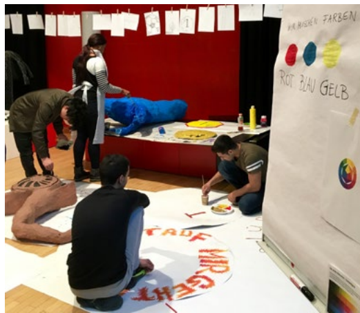
Abb.5: Farbenlehre. KUNSTLABOR Graz, A. Fischer, 2018

Materialien: Farben (Acryl), Malutensilien