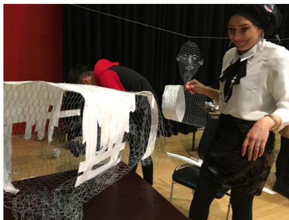
Abb.3: Objekt-Oberfläche. KUNSTLABOR Graz, A. Fischer, 2018