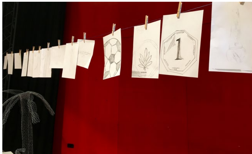
Abb.1: Objekt-Entwurf. KUNSTLABOR Graz, A. Fischer, 2018