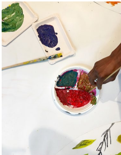
Abb.6: Komplementärfarben. KUNSTLABOR Graz, A. Fischer, 2018

Siehe hierzu ggf. den Farbkreis von Itten 1 ausdrucken.