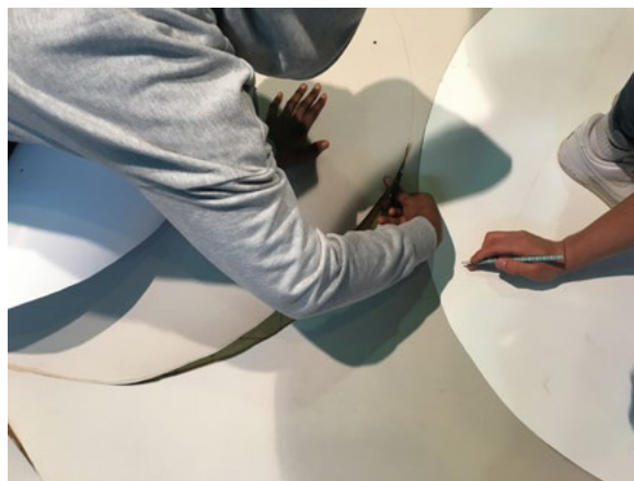
Abb. 9: Ausschneiden der Spots. KUNSTLABOR Graz, A. Fischer, 2018

Für die Präsentation der Objekte werden Spots, d.h. Kreise aus Pappe ausgeschnitten und jede/r Lernende gestaltet seinen/ihren Kreis mit dem Titel der Arbeit und seinem/ihrer Namen. Diese Spots werden im Raum auf dem Boden gelegt. Die Skulpturen hängen im Raum über oder neben den Spots. Die Lernenden stellen sich zu ihren Spots. Beim Rundgang durch das „Museum“ wird das Publikum von einem Spot zu nächsten geführt. Hier erfährt der Besucher die Geschichte(n) der Skulpturen. Es können Fragen gestellt werden und die Lernenden, in der Rolle der Vermittler_innen, geben Auskunft über die ausgestellten Werke.