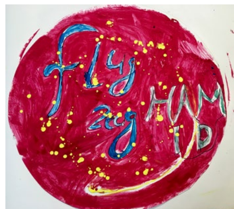
Abb. 10 und 11: Gestaltung der Spots. KUNSTLABOR Graz, A. Fischer, 2018