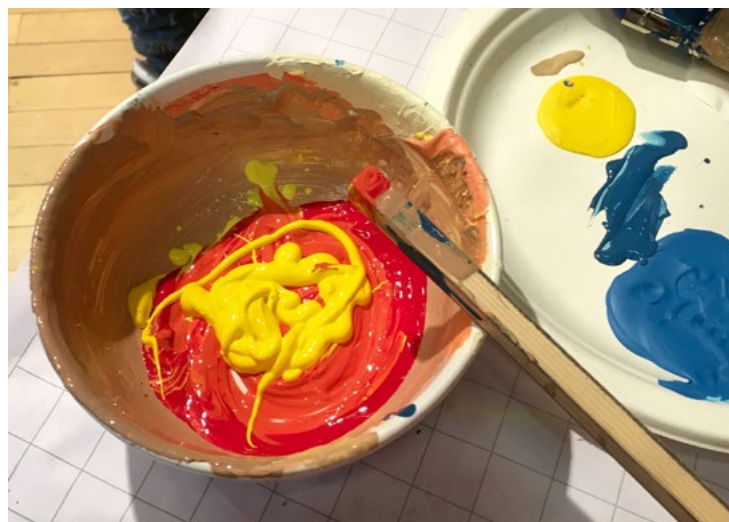
Abb.7: Wie ermische ich eine Hautfarbe? KUNSTLABOR Graz, A. Fischer, 2018

Zum Glück hat jeder Mensch eine Lieblingsfarbe... oder auch mehrere und das ist eine sehr individuelle Sache!